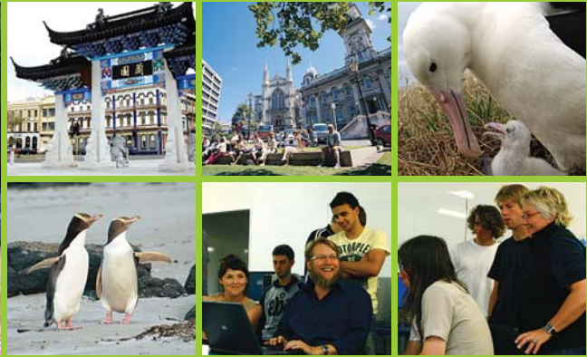
Dunedin and surrounds. Otago Polytechnic classroom.