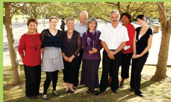
Your Student Support Team at Otago Polytechnic.