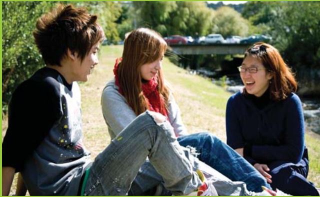
ESOL students relaxing near our Dunedin Campus.