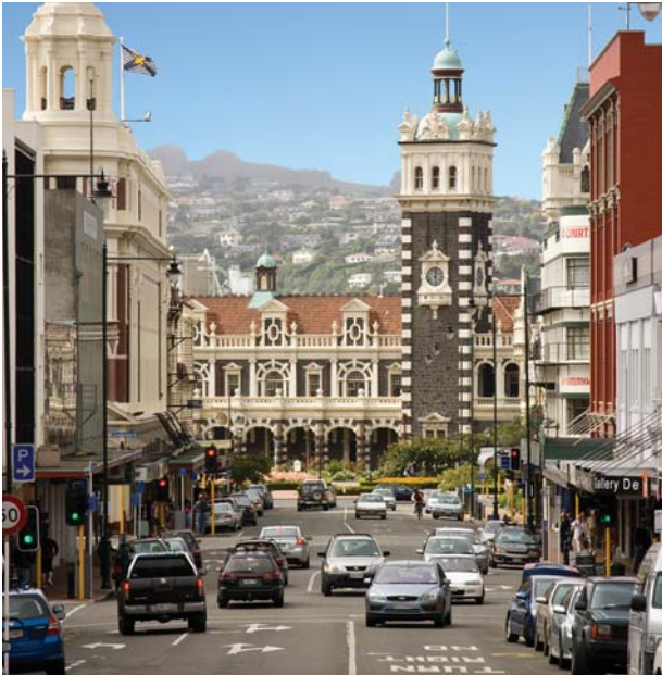
Top: St Clair beach, Bottom: Downtown Dunedin