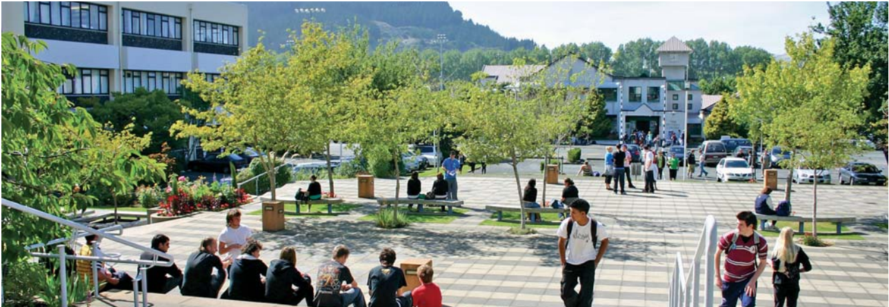
Otago Polytechnic Dunedin Campus