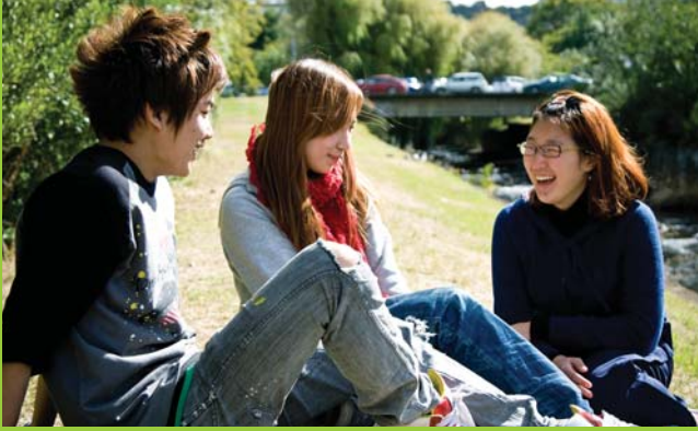
ESOL students relaxing near our Dunedin Campus.