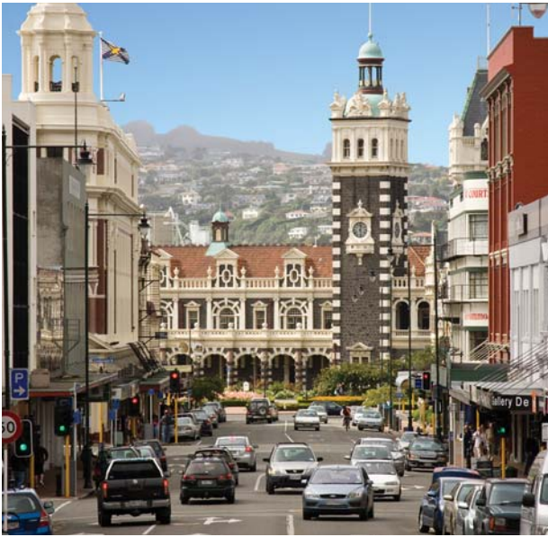
Top: St Clair beach, Bottom: Downtown Dunedin