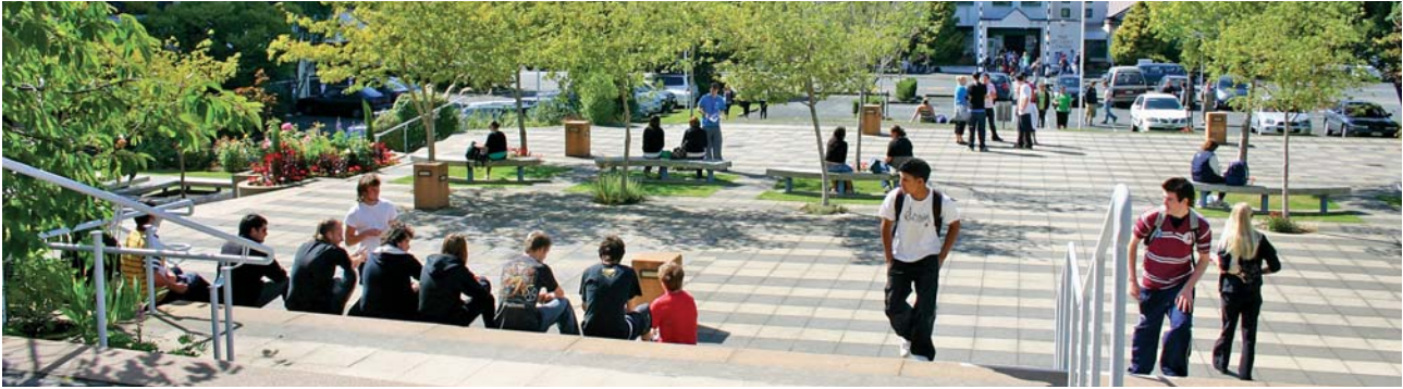
Otago Polytechnic Dunedin Campus