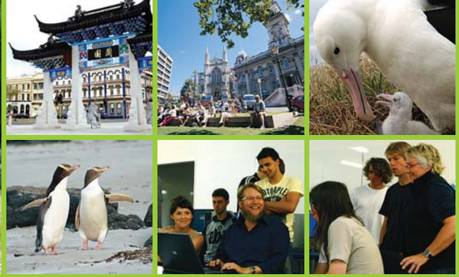
Dunedin and surrounds. Otago Polytechnic classroom.